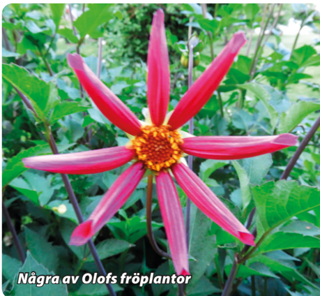
Några av Olofs fröplantor