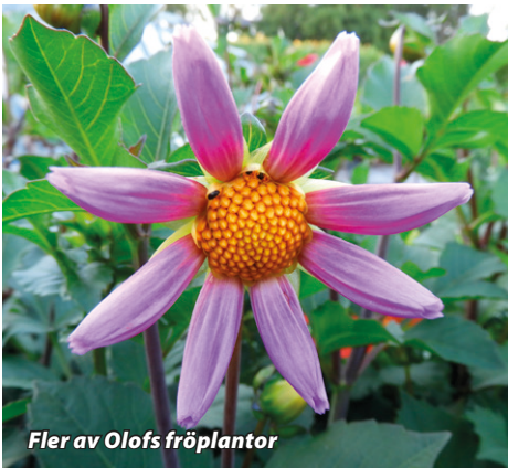
Fler av Olofs fröplantor

Ring mobil nr 0731-801516 för bokning av tid.