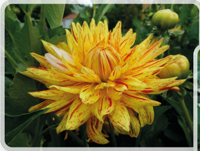
Fler av dahliorna från Varnhem