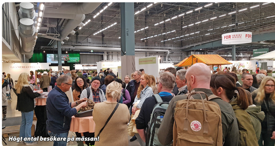
Högt antal besökare på mässan!

Vi har väl aldrig haft ett sådant högt besöksantal i vår monter på mässan som i år. Stundtals stod det folk i tredubbla rader och letade efter dahliaknölar.