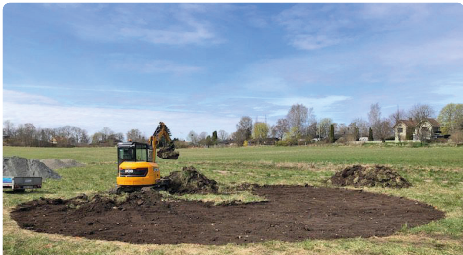
Bit för bit växer området fram