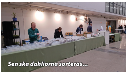
Sen ska dahlorna sorteras...