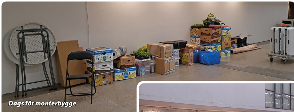
Dags för monterbygge