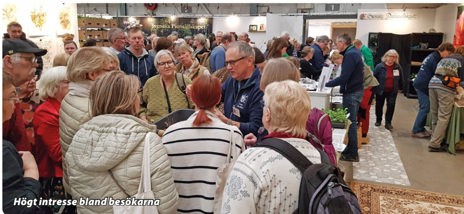
Högt intresse bland besökarna