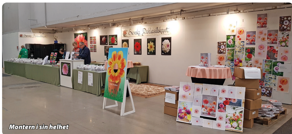
Montern i sin helhet

Hoppas vi ses även nästa år och att vi kan få in knölar till försäljning även då.