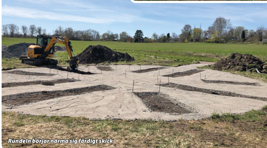
Rundeln börjar närma sig färdigt skick