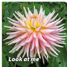
Look at me