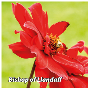
Bishop of Llandaff