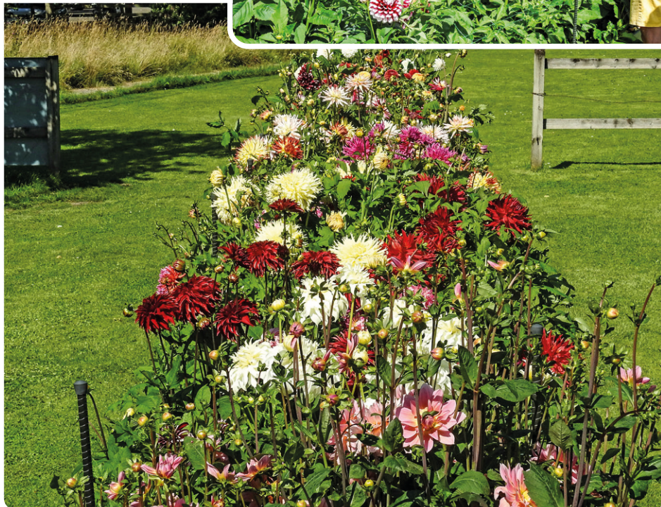
Juli - Intresserade besökare (mitten). Augusti inleds med otrolig blommning (stora bilden).