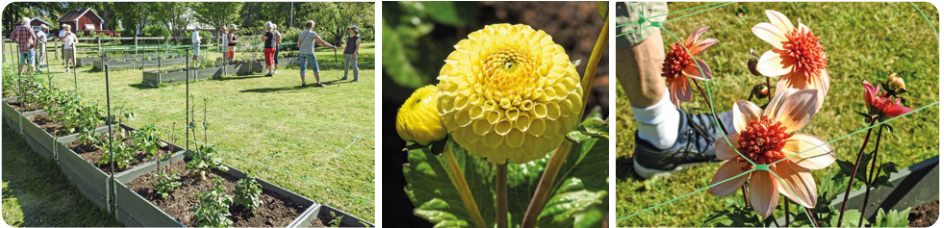
2 juni - En och en halv vecka efter plantering - många har redan knopp (vänster). Buttercup har precis slagit ut (mitten). Totally Tangerine är också igång (höger).

25 juni - 5 veckor efter plantering och många sorter blommor redan.