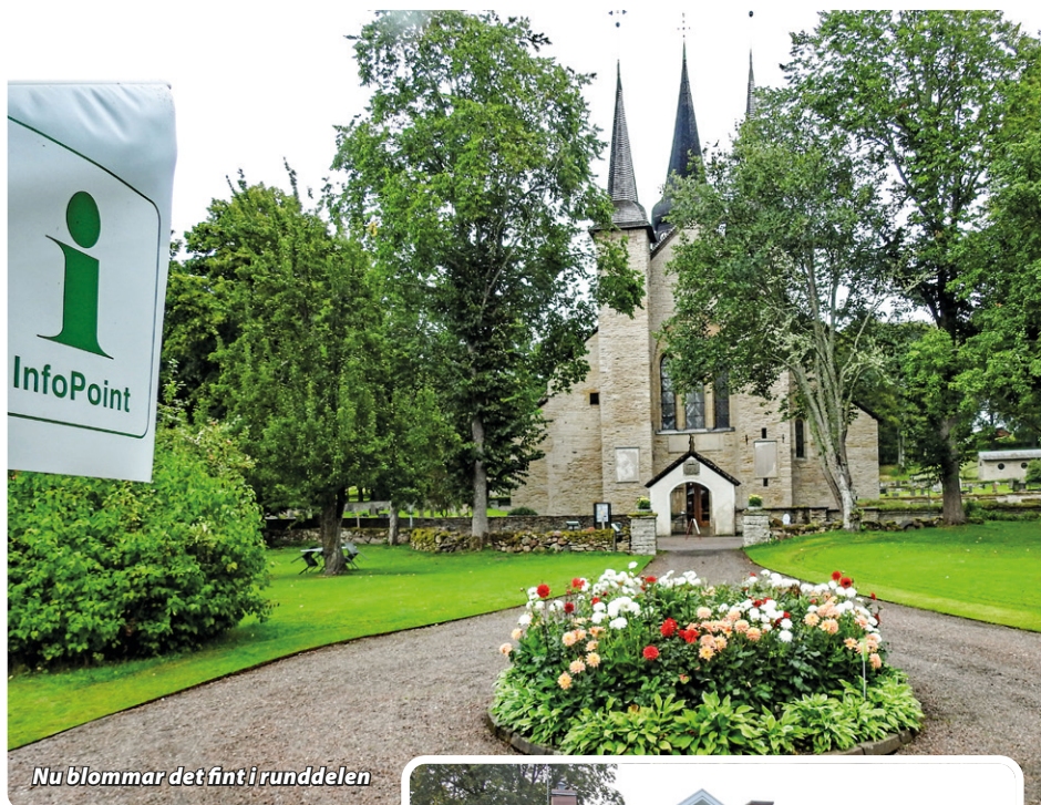
Nu blommar det fint i runddelen

Ytterligare ett år med våra odlingar i Varnhem är till ända. Även detta år blev en succé på alla sätt och vis. Det har blommat otroligt fint hela juli, augusti och september, och vi har fått möta mycket folk som har sett våra dahliaodling och förundrats över prakten och mångfalden.