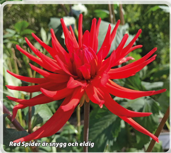
Red Spider är snygg och eldig

I årets rabatt finns många sorter med öppen mitt, såsom enkelblommande-, halskrås- och stjärndahlia. De dahlia som har fyllda blomkorgar är snygga och dom finns här med men de med öppen mitt attraherar pollinatörer (bin, fjärilar och blomflugor m fl). Och de vill vi ju såklart locka hit. Jag älskar alla dahlia jag valt ut, mer eller mindre, men det är nästan