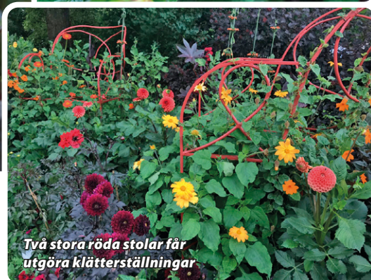
Två stora röda stolar får utgöra klätterställningar

I botaniska var det en 60 m lång rabatt där vi planterade ner ett 20-40 tal olika sorters dahlior som vi förödlade i ett växthus. Då var det inte mycket tanke på komposition eller att erbjuda estetisk variation. Det fanns heller ingen information som gav besökaren kunskap om vad dom såg. Rabatten ifrågasattes på 90-talet och jag sporrades då att bevisa att dahlior minsann inte så lätt kan överträffas som skönhetsupplevelse i blomstervärlden om man bara tänker till noga hur de kan presenteras och väljer ut fina sorter. Jag tog också in många vilda arter av dahlialäktet så man kunde se utvecklingen av dahlia som selektion och hybridisering har gett över åren. Även om de vilda dahlorna är mycket vackra i all sin enkelhet är det svårt att inte imponeras av många tjugiga hybrider.