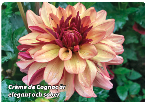
Crème de Cognac är elegant och sober