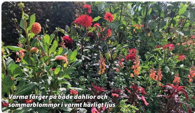
Varma färger på både dahlior och sommarblommor i varmt härligt ljus

Och det finns så mycket fina dahlior, och variationen i utseende så stor. Det ville jag visa, och jag ville visa det utan att rabatten skulle upplevas som en vild blandning av färger och former. Nej jag vill att varje bit, utsnitt av rabatten, skulle visa mycket samtidigt som det ändå fanns en harmoni. Blommorna skulle lyfta fram varandra!