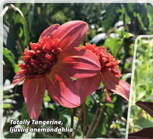
Totally Tangerine, ljuvlig anemondahlia