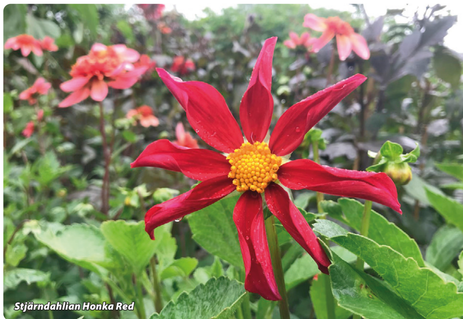
Stjärndahlia Honka Red

alltid så att jag har någon favorit – vilken det är varierar över tid. I år är det utan tvekan 'Happy Single Kiss.'