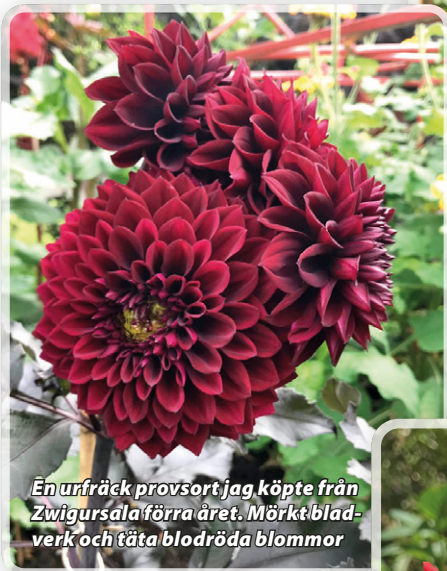
En urfräck provsort jag köpte från Zwigursala förra året. Mörkt blad- verk och täta blodröda blommor