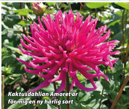
Kaktusdahlia Amoret är för mig en ny härlig sort