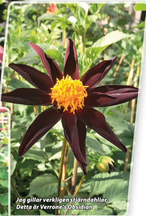
Jag gillar verkligen stjärndahlia. Detta är Verrone's Obsidian