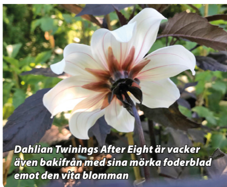
Dahlia Twinings After Eight är vacker även bakifrån med sina mörka foderblad emot den vita blomman