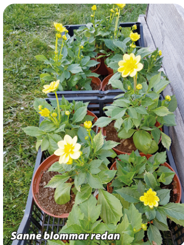
Sanne blommor redan