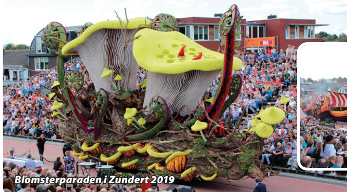
Blomsterparaden i Zundert 2019