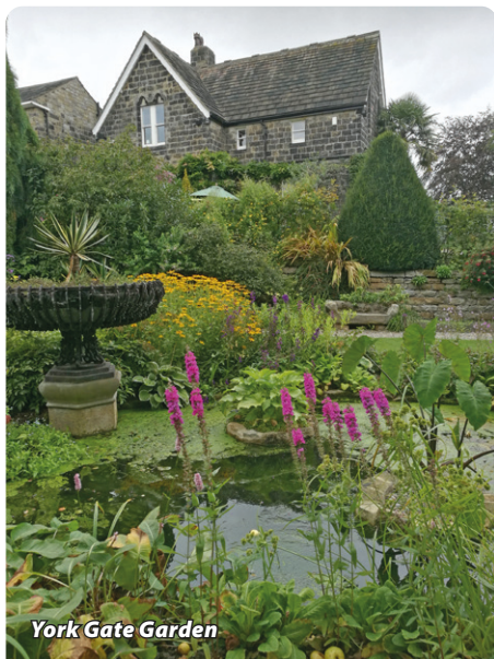
York Gate Garden

Vi är först på plats och hänger på läset, så vi ska få så mycket tid som möjligt. Oj vad det var mycket att se – alla dessa otroliga grönsaker av alla de slag och frukter. Här var det inte svårt alls att slå ihjäl tiden. När vi väl kom till dahlorna – vilket tog en stund – så hade själva klassificeringen varit och priser delats ut. Vi fick en guidning av en domare som talade om för oss hur de bedömer dahlior. Denne man hade varit med i 24 av 25 år och visste vad man skulle titta efter. Det fanns ju inte bara dahlior, utan krysanthemum, gladiolus, bonsaier och mycket mycket mer.