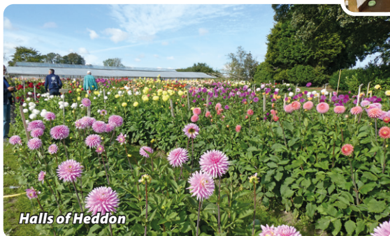
Halls of Heddon

det häftiga huset från 1600 -talet, och fick ta del av den fantastiska inredningen. De sista som skrivit i slottets Gästbok är prinsessan Anne och även prins Charles och Camilla. Som en liten anekdot om just Newby Hall – Ägaren till detta charmiga slott