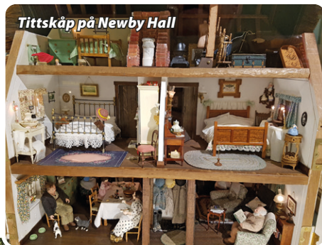
Tittskåp på Newby Hall