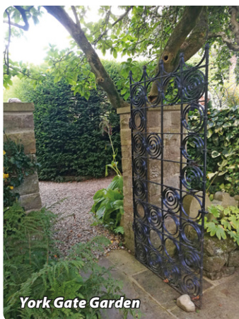
York Gate Garden

Uniteds arena och Manchester citys arena. Fotbollen är ju en jättestor sport här i England, och det förstår man när man ser dessa enorma arenor.