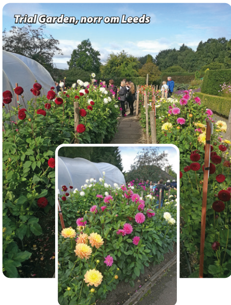
Trial Garden, norr om Leeds