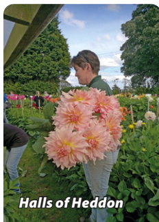
Halls of Heddon

En speciell avdelning med dahlior fanns ju också förstås, och blev man trött i benen kunde man åka tåget runt anläggningen. De hade också tittskåpsutställning med helt fantastiska detaljrika tittskåp. Här fick vi även en guidad vandring i