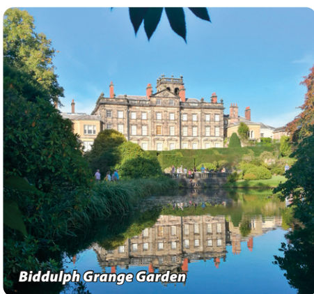
Biddulph Grange Garden